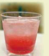
Plum Wine Soda

Plum Wine (Rock/Soda) TAN TAKA TAN SHISO 梅酒 ロック or ソーダ ¥750