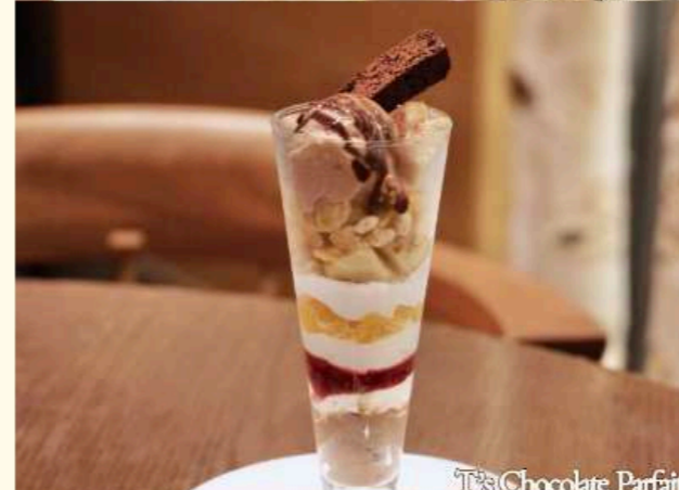
T's Chocolate Parfait