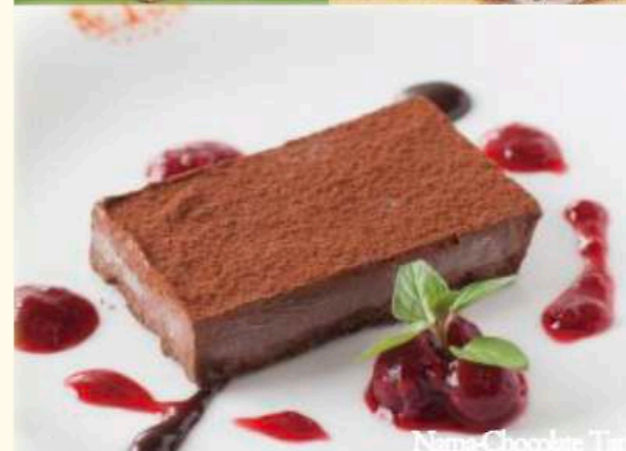
Nama Chocolate Tart