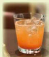
Plum Wine Soda

Plum Wine (Rock/Soda) 紀州「一根六菜」(梅酒) ロック or ソーダ ¥650