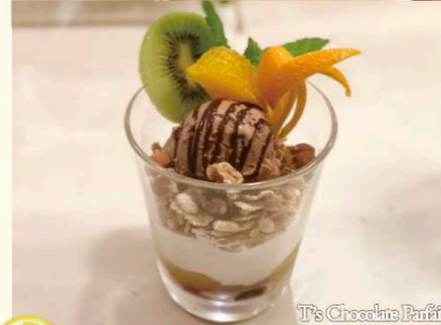
T's Chocolate Parfait