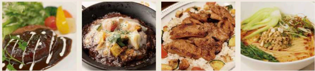
Hamburg Steak Cheese Curry Soy Meat Rice Plate Tantan Noodle