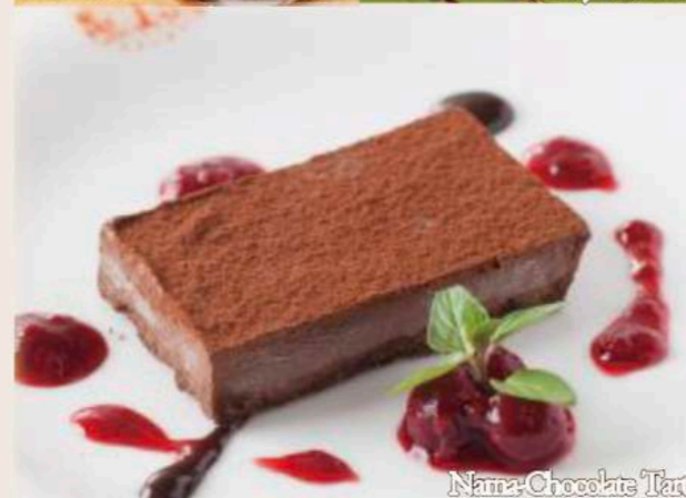
Nama Chocolate Tart