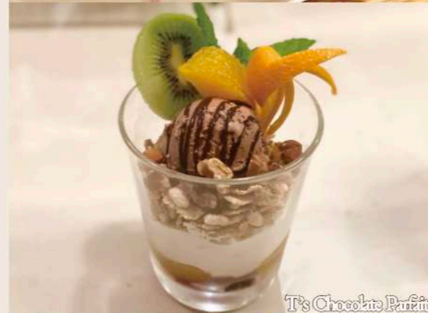
T's Chocolate Parfait