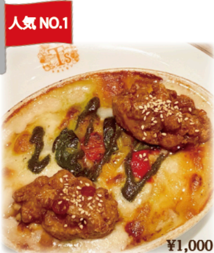
人気 NO.1 ◆パエリアドリア Paella Doria ※写真はソイミートの油淋鶏トッピング+¥200

え!?! お肉じゃないの!?! 野菜と大豆ミートでできたヴィーガン料理 スマイルベジ カラダよろこぶ SmileVeg