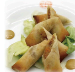
◆ソイミート中華春巻き Fried Spring Rolls 3sticks ¥900