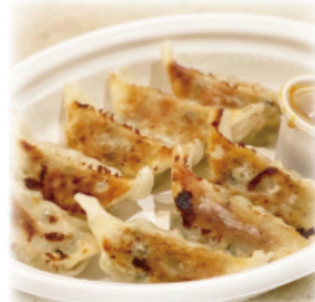
◆ソイミート餃子 Soy Meat Dumplings 8pcs ¥800~