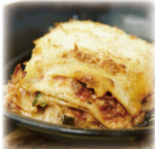
◆クリーミーベジラザニア Creamy Veg Lasagna ¥1,200