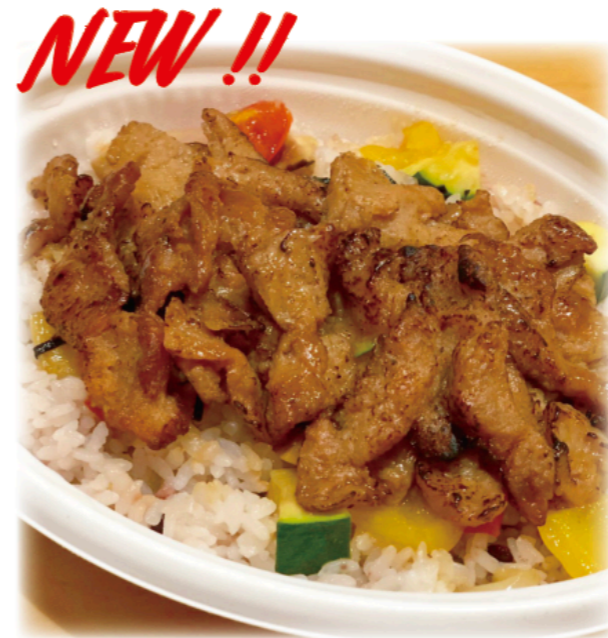
NEW !! ◆グリルソイミート弁当 Grilled Soy Meat Lunch Box ¥1,000