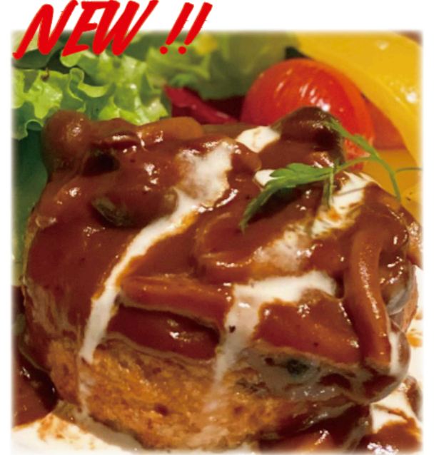
NEW !! ◆オムニハンバーグ Vegan Hamburg Steak ¥1,800 オムニミートを使い肉感をさらにアップしてリニューアル!