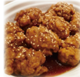
◆ソイミート油淋鶏 Soy Meat Yurinchi 8pcs ¥700