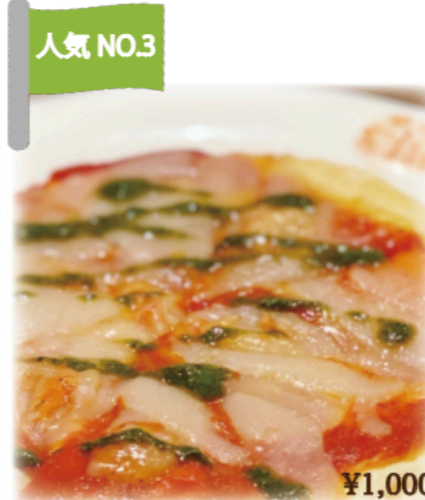
人気 NO.3 ◆マルゲリータピザ Vegan Margerita Pizza