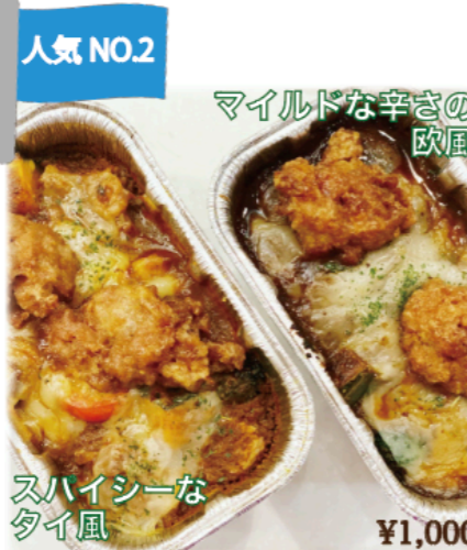
人気 NO.2 ◆焼きヴィーガンチーズカレー Baked Vegan Cheese Curry (Veggie Curry or Thai Curry) ※写真はソイミートの油淋鶏トッピング+¥200